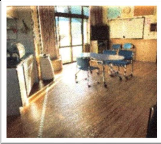
1F タイル張り替え後